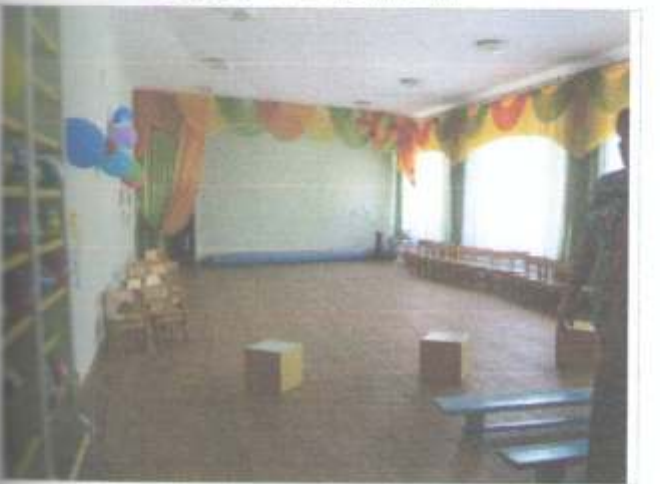
Фото №23 – Зона оказания услуг