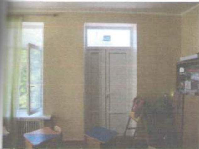
Фото №61 – Пути движения внутри здания