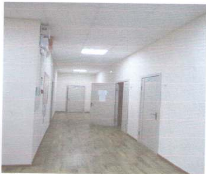
Фото №71 Пути движения Модуль