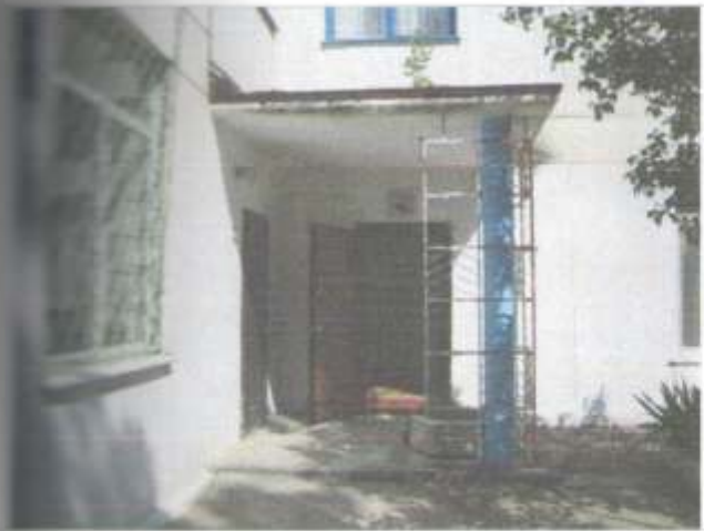
Фото №7 – вход в здание «А»( центральный)