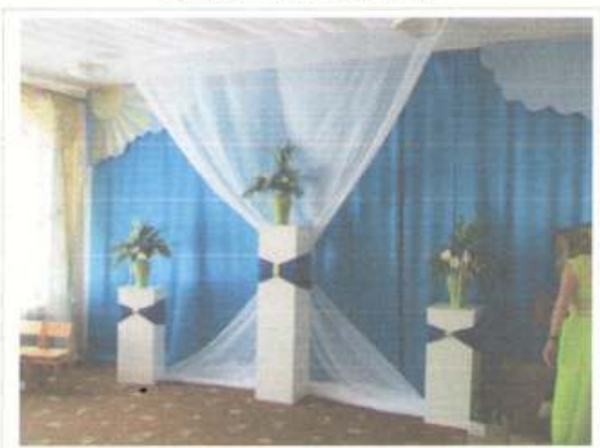
Фото №54 – Зона оказания услуг