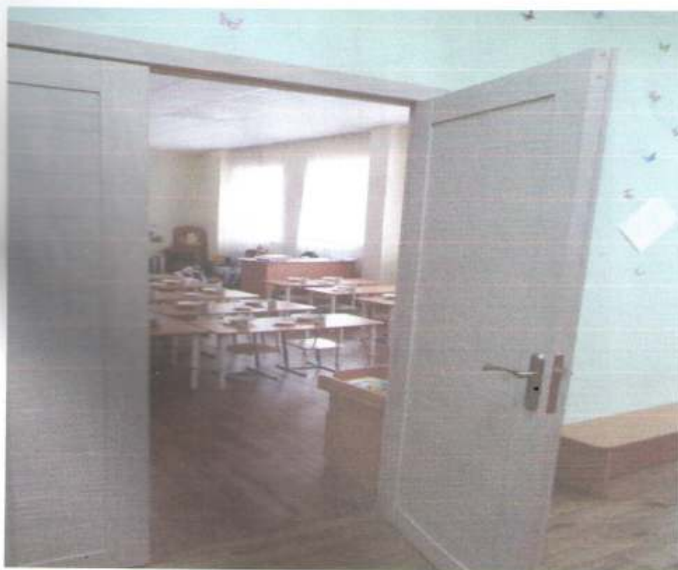
Фото № 74 Зона оказания услуг