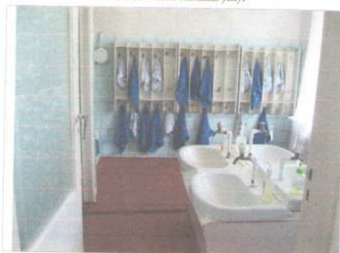
Фото №58 – Санитарно-гигиенические помещения