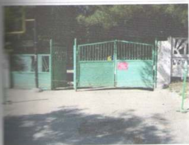
Фото №1 – Вход на территорию (центральный)