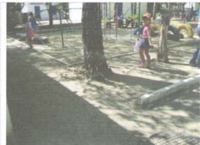
Фото №64 – Прилегающая территория