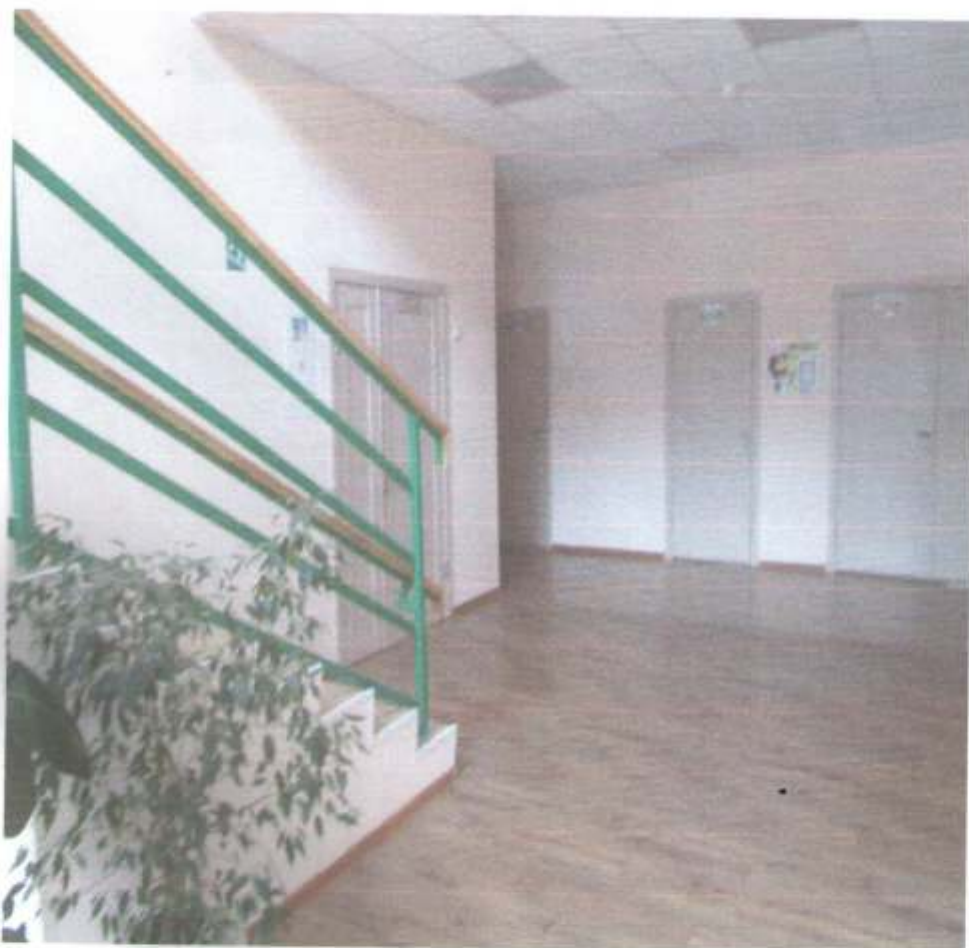
Фото № 72 Пути движения Лестница внутри здания. Модуль