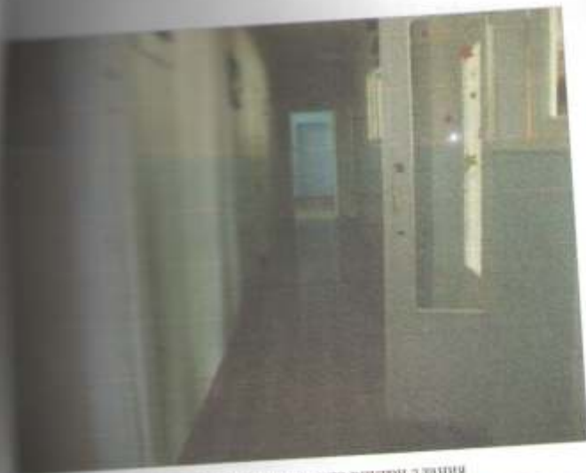
Фото №43—Пути движения внутри здания