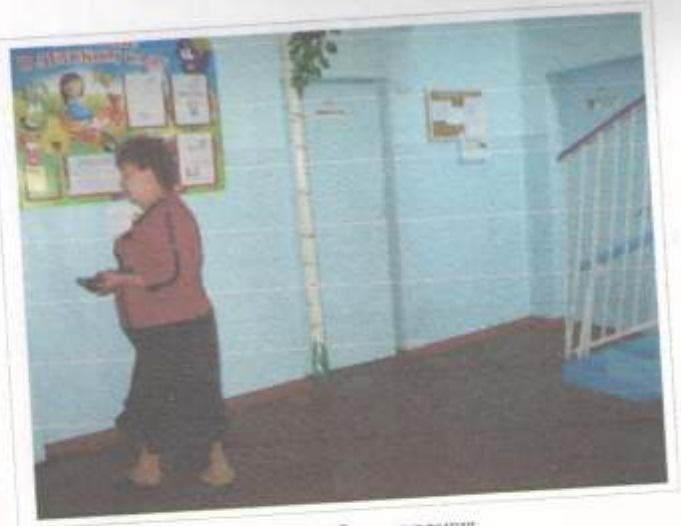
Фото №38 – Зона ожидания