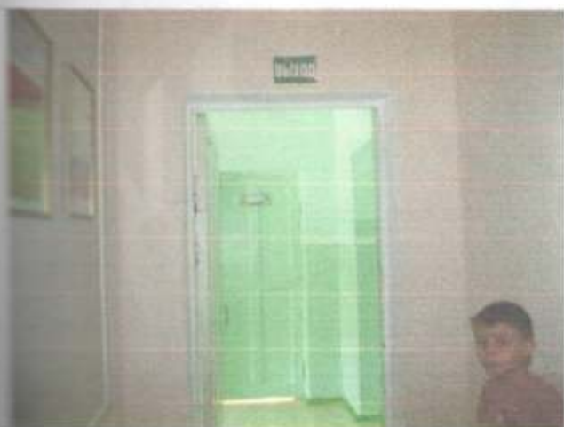
Фото №17 – двери