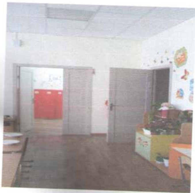
Фото № 70 Зона оказания услуг Модуль