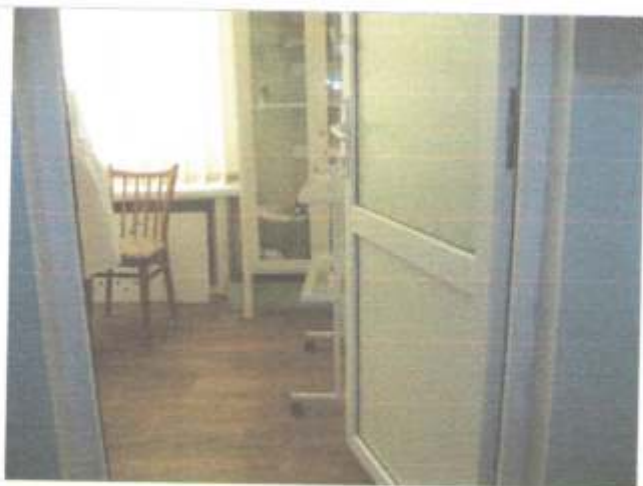
Фото №56 – Зона оказания услуг