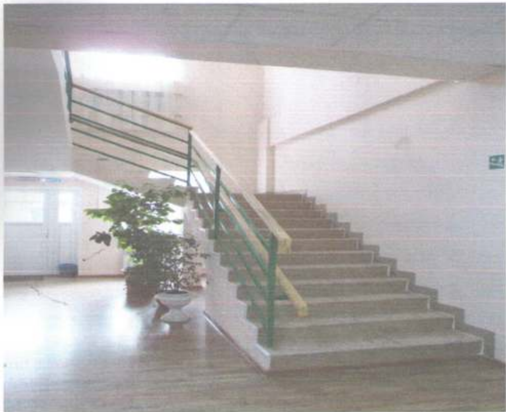
Фото № 67 Центральный вход. Лестница