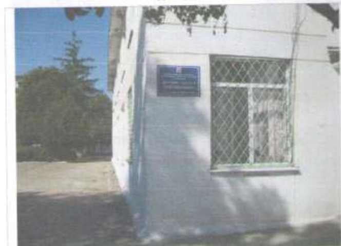
Фото №4 – Информация об объекте