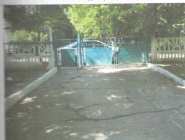
Фото №3 – Вход на территорию (со стороны водоканала)