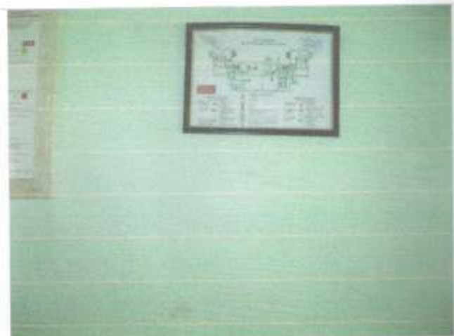
Фото №26 – Пути эвакуации