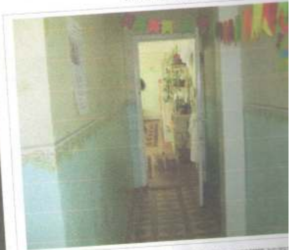
Фото №46 – Путь движения к зоне оказания услуг