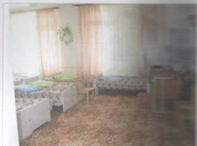
Фото №20 – Зона оказания услуг