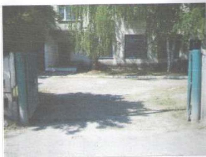
Фото №2 – Вход на территорию (со стороны РСО/Па)