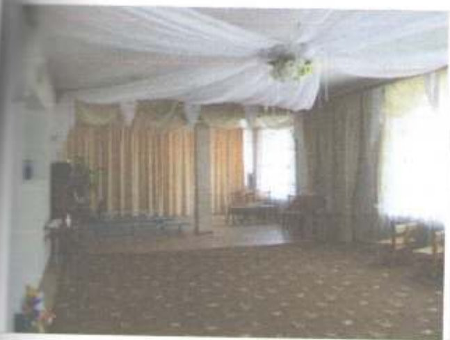
Фото №55 – Зона оказания услуг