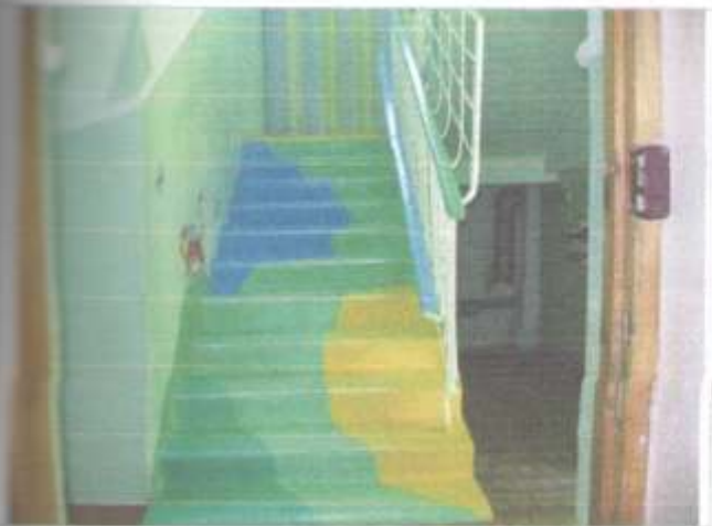
Фото №13 – Лестница внутри здания