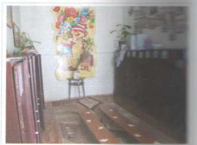
Фото №22 – Гардероб