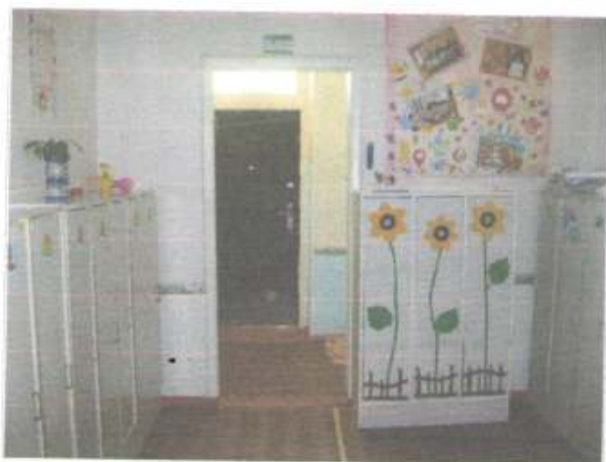
Фото №60 – Гардеробная