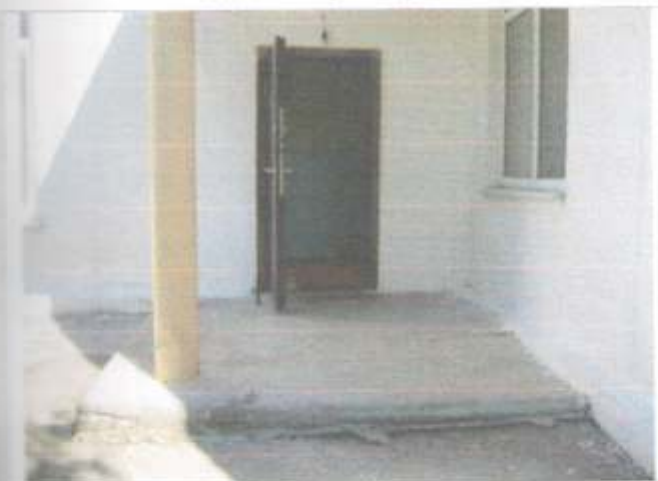
Фото №29 – Запасной выход здания «А»