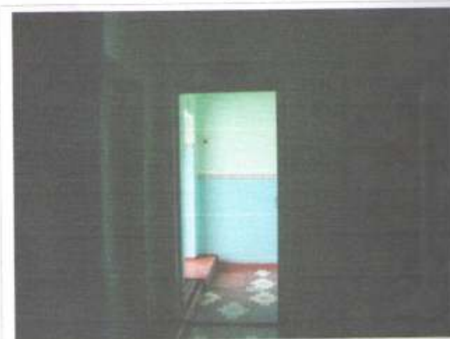
Фото №28 – Пути эвакуации