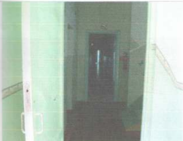
Фото №11 – Пути движения внутри здания