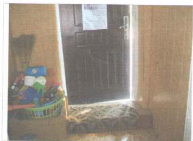
Фото №33 – Пути эвакуации