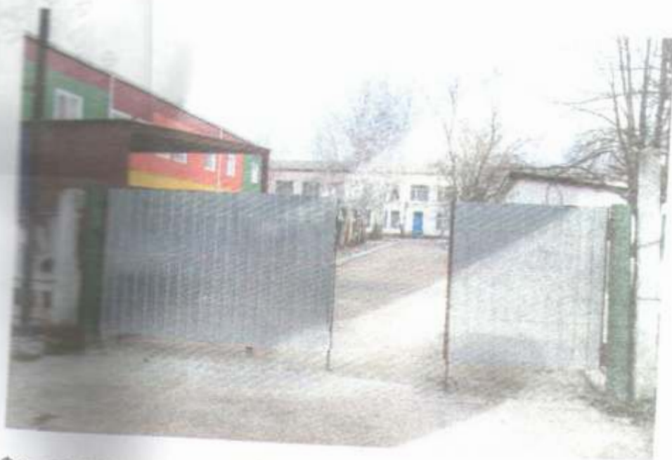
Фото № 80 Вход в ворота со стороны ул. Гагарина в Модуль