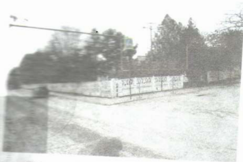
Фото № 79 Пешеходный переход Тротуар