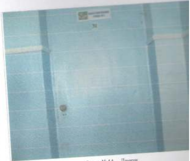
Фото №44 – Двери