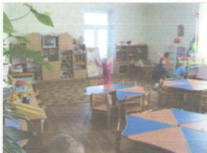
Фото №52 – Зона оказания услуг