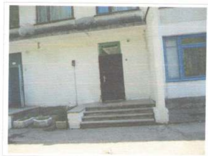
Фото №35 – вход в здание «Б»