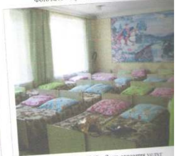
Фото №48 – Зона оказания услуг