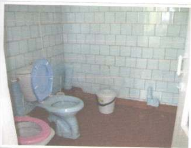
Фото №59 – Санитарно-гигиенические помещения