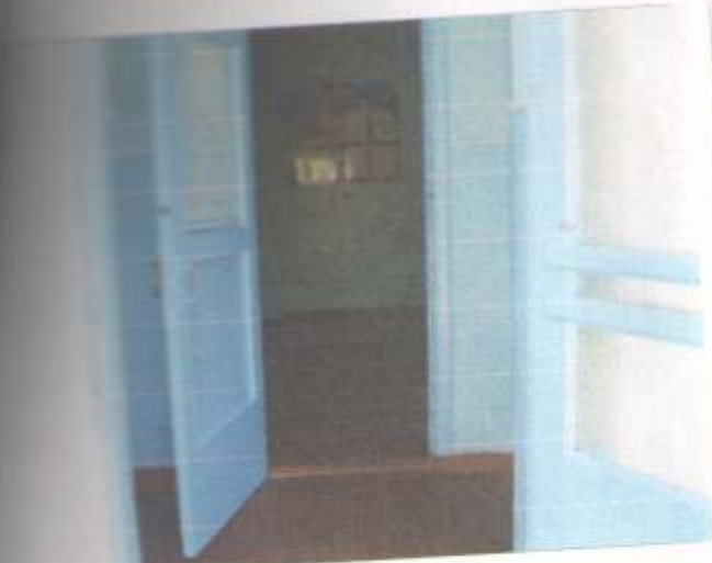
Фото №37 – Тамбур здания «Б»