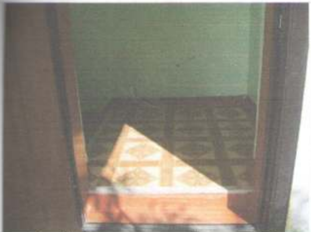
Фото №9– Входная дверь в здание «А»( центральный)