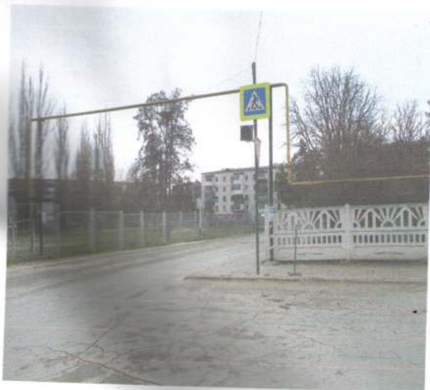
Фото № 76 Пешеходный переход светофор