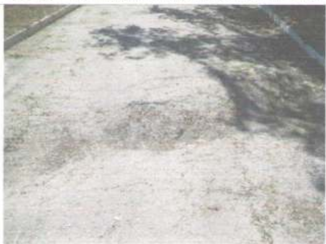
Фото №65 – Прилегающая территория