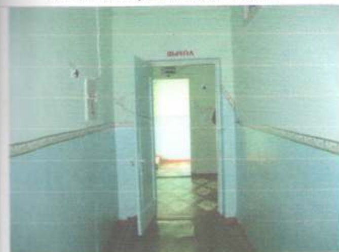
Фото №27 – Пути эвакуации