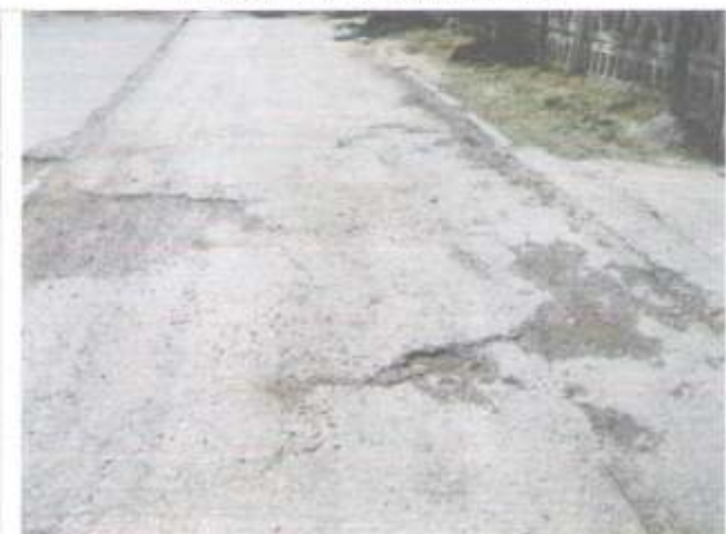
Фото №66 – Прилегающая территория