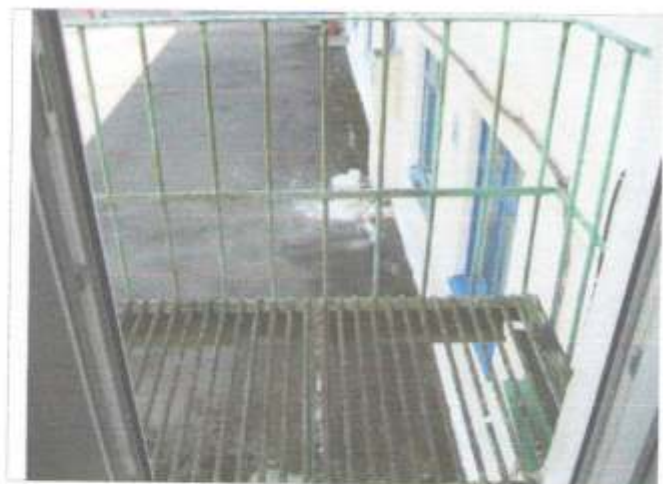
Фото №31 – Пути эвакуации(запасной выход здания «А» 2 этаж)