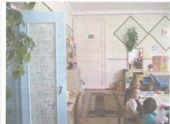
Фото №49 – Зона оказания услуг