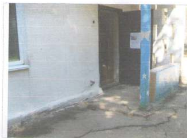
Фото №34 – Пути эвакуации