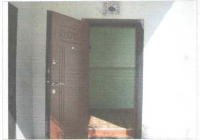
Фото №8 – Входная дверь в здание «А»( центральный)