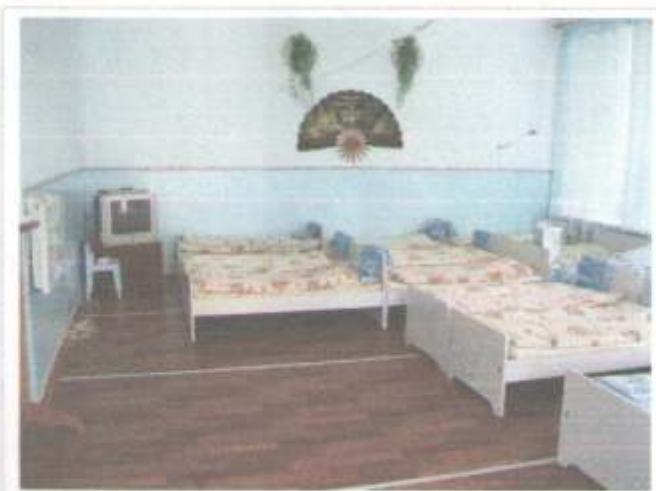
Фото №51 – Зона оказания услуг