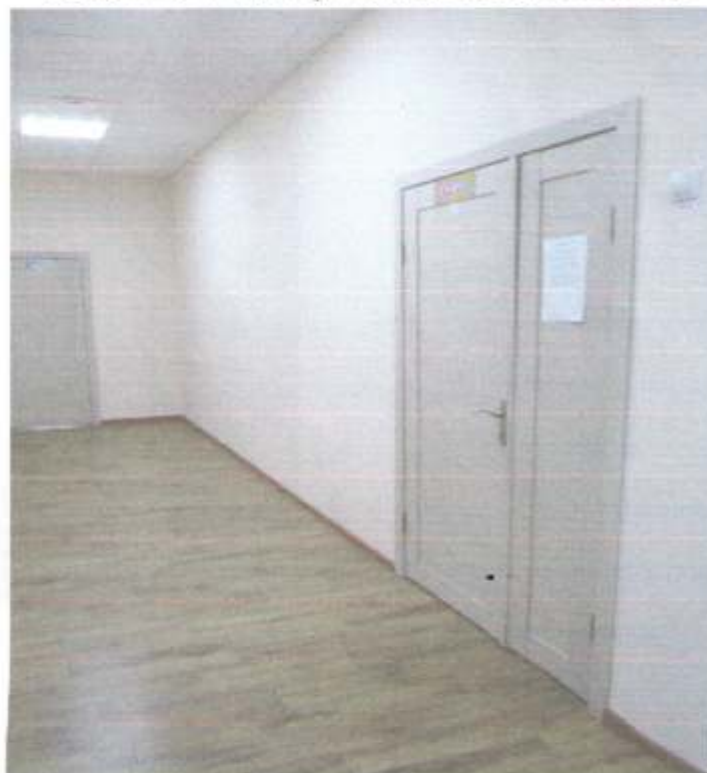
Фото № 68 Двери внутри здания