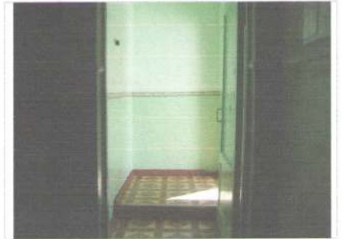
Фото №10 – Тамбур здание «А»( центральный)