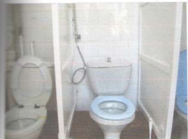
Фото №25 – Санитарно-гигиенические помещения