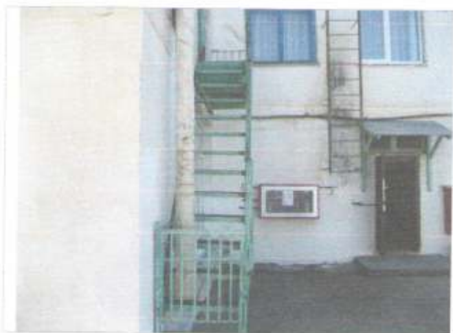
Фото №32 – Пути эвакуации(запасной выход здания «А» 2 этаж)