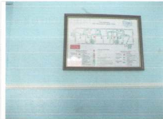
Фото №62 – Пути эвакуации