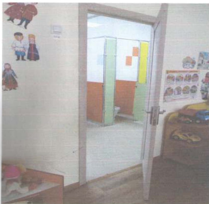
Фото № 73 Зона оказания услуг Модуль