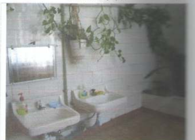
Фото №24 – Санитарно-гигиенические помещения