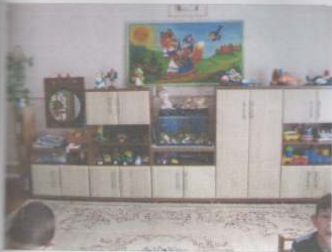
Фото №19 – Зона оказания услуг