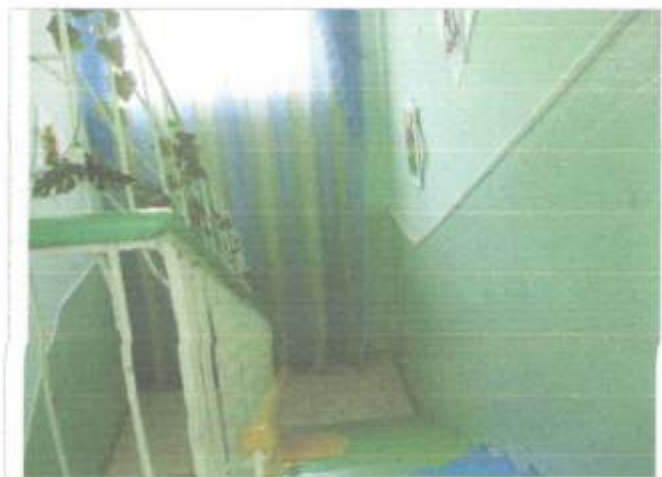
Фото №14 – Лестница внутри здания