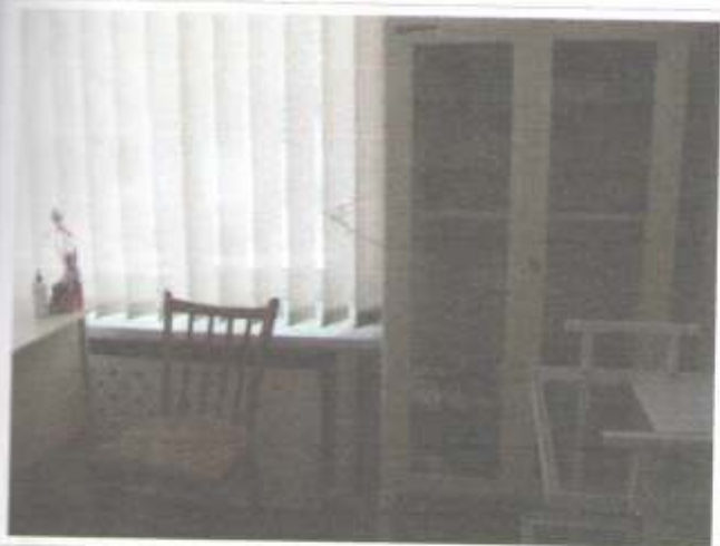
Фото №57 – Зона оказания услуг