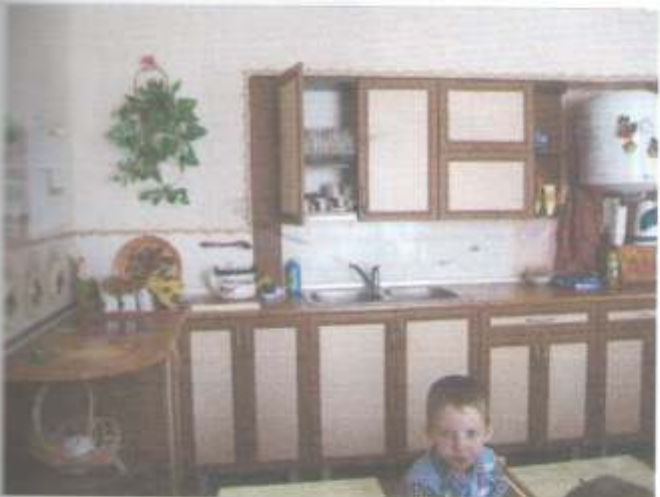
Фото №21 – Зона оказания услуг