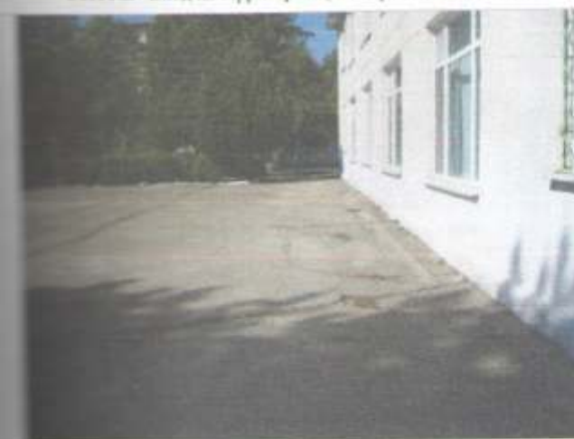
Фото №5 – Прилегающая территория