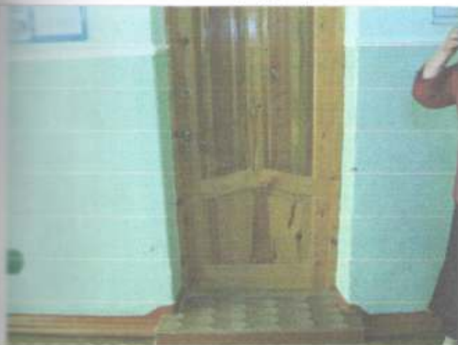
Фото №15 – Двери