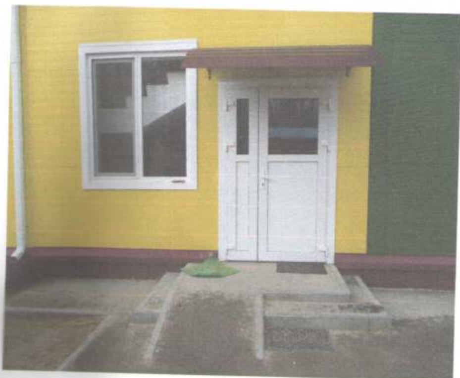
Фото № 75 Вход в Модуль