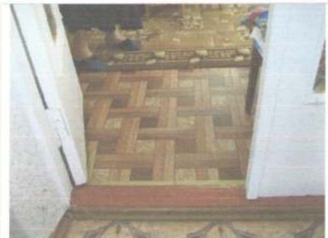
Фото №50 – Двери внутри здания