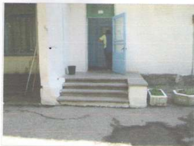
Фото №36 – вход в здание «Б»( центральный)