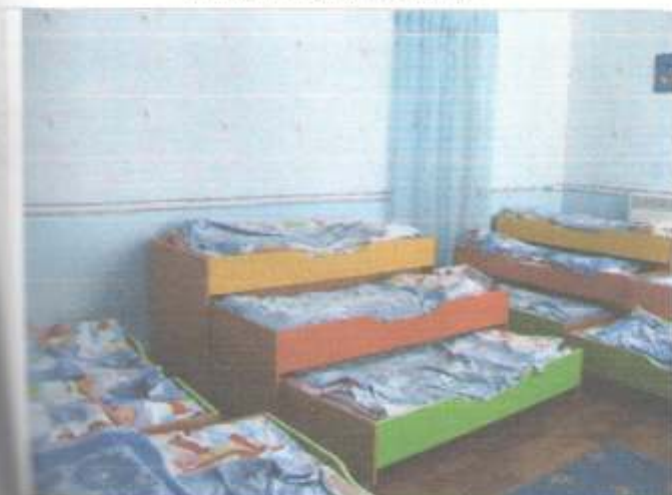
Фото №53 – Зона оказания услуг