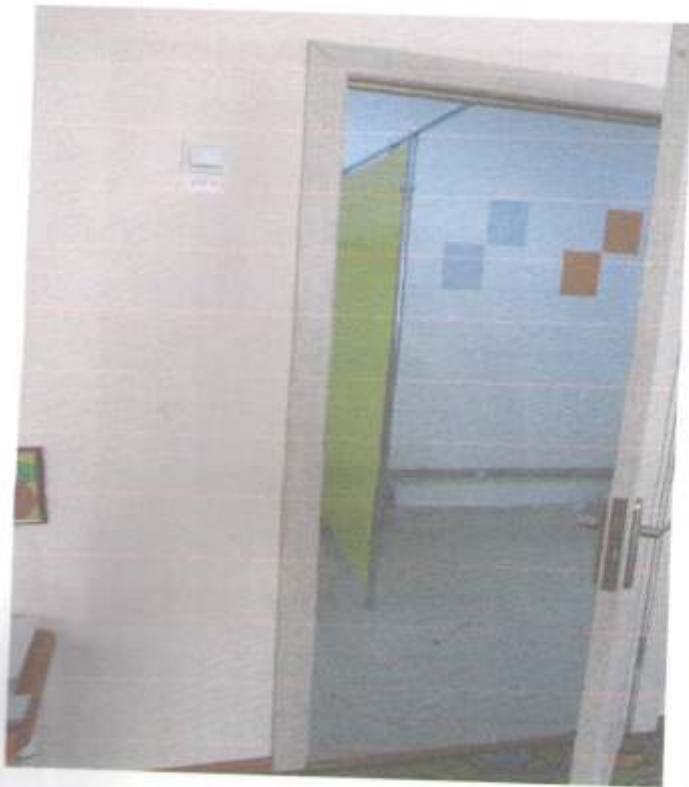
Фото № 69 Вход в санитарную зону Модуль