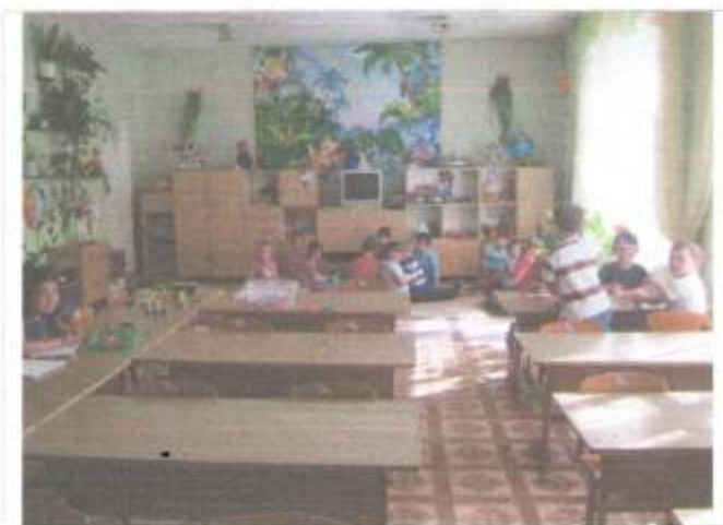
Фото №18 – Зона оказания услуг