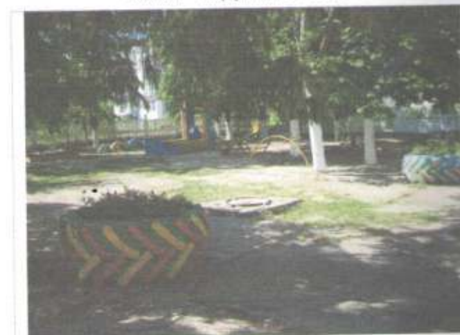
Фото №6 – Прилегающая территория