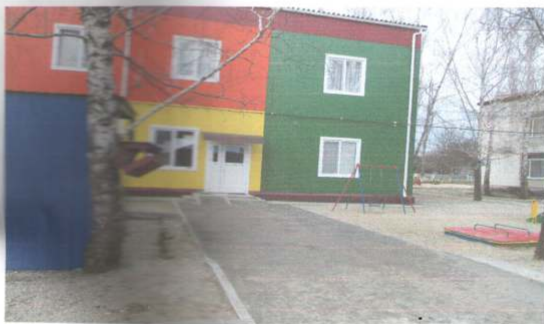
Фото № 78 Вход в Модуль