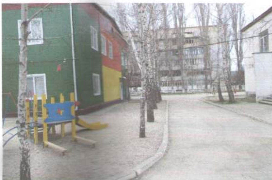
Фото № 77 Прилегающая территории Модуль