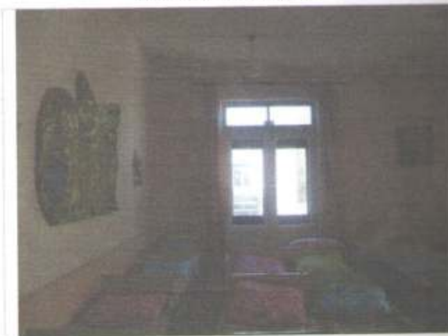
Фото №30 – Пути эвакуации(запасной выход здания «А» 2 этаж)