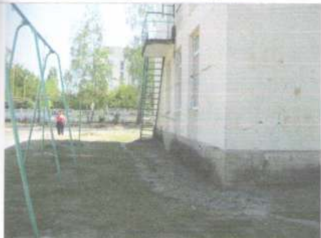
Фото №63 – Пути эвакуации (запасной выход здания «Б» 2 этаж)